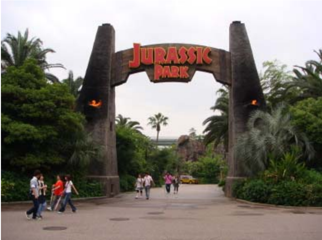
「侏羅紀公園」主題區