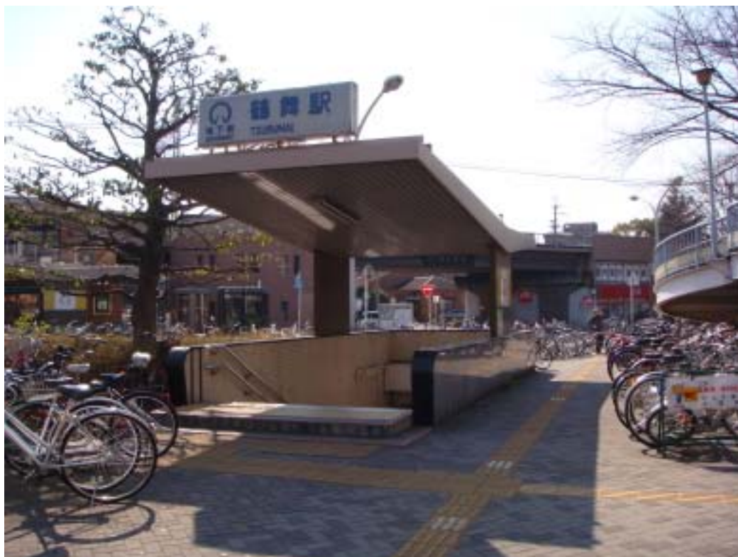
距名工大最近的地下鐵站-鶴舞駅

這次來日本的期間，也讓我覺得日本的交通真的很方便，在比較大的都市，其地下鐵及 JR 的交通網絡真的很綿密，換車也幾乎不用出站就可走到別的月台搭車，尤其是首都東京，因為旅遊的關係而到東京，東京的 JR 與地下鐵真的是錯綜複雜，不仔細研究的話，還真讓人頭痛。另外，我在京都旅遊的時候，還見識到了一種公車，它底盤頗低的，在開車門讓人上下車時會傾斜讓人上下車，上下車的部分則是斜坡的設計，而不是樓梯式的設計，算是開了眼界。