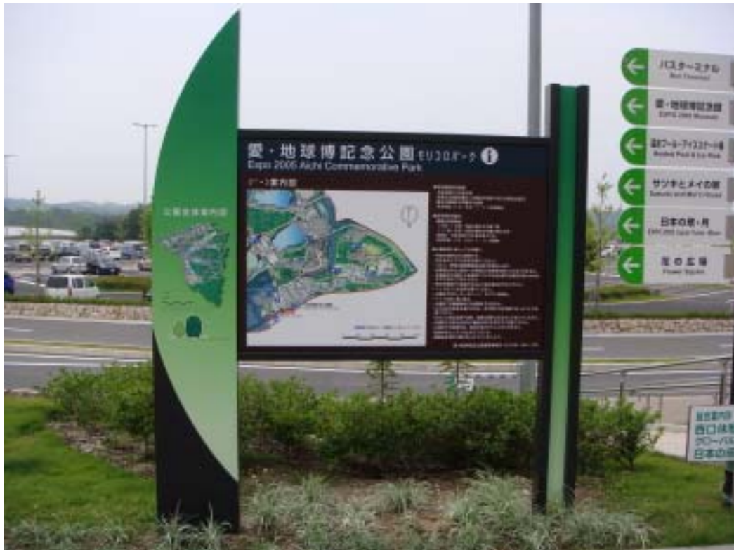
愛・地球博記念公園

豐田博物館的附近，還有當初舉行萬國博覽會的「愛・地球博紀念公園」，公園內除了萬國博覽會的紀念館外，還有摩天輪可以乘坐，以及室內溫水游泳池，而且公園內的佔用面積很大，很適合戶外活動及親子同遊。