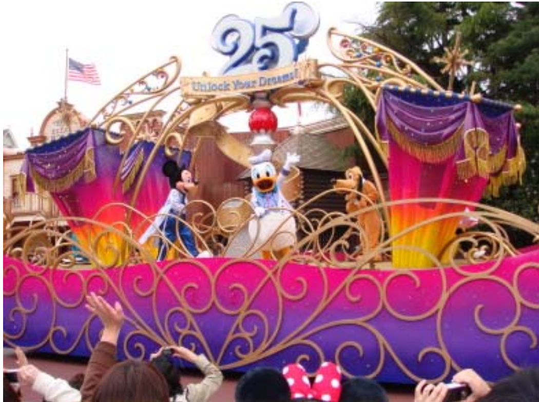
迪士尼樂園內的遊行