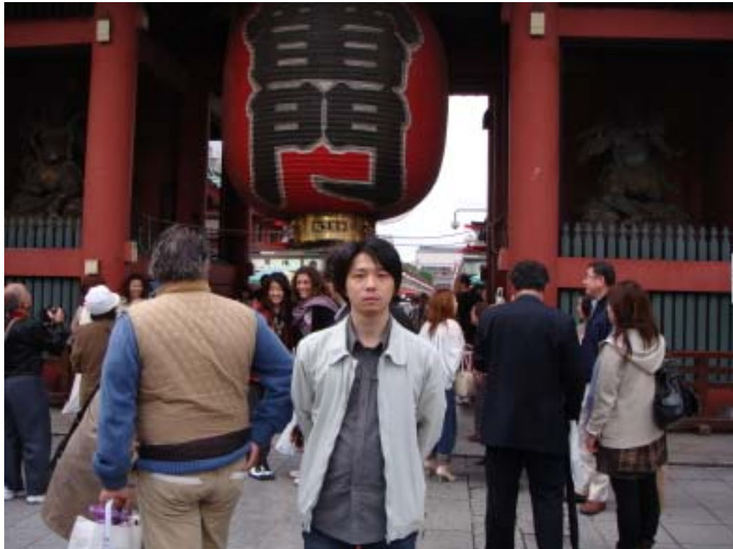
在淺草雷門前留影

東京這個大都市，是在我堂哥跟堂嫂來日本自由行的期間，跟著他們一起去，在安排旅遊行程時也讓我認識到東京的交通網路非常的綿密，一度讓我在規畫路線時，感到頭痛，因為交通手段真的很多。在東京我們去了我最想見識的淺草雷門、宮崎駿的吉卜力美術館、以及知名的秋葉原電器街還有迪士尼樂園，比較讓我意外的是東京迪士尼樂園，因為真的比我想像中的好玩太多了，樂園內的遊行也是不容錯過的，也因為帶小孩的家長很多，讓我看到一幅很有趣的景色，那就是排的整齊的嬰兒車，簡直就像是嬰兒車的停車場。