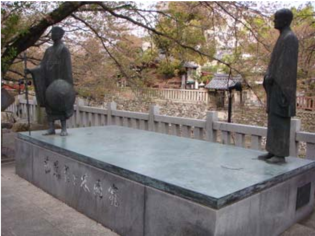
左邊就是松尾芭蕉的銅像，位於奧之細道終點