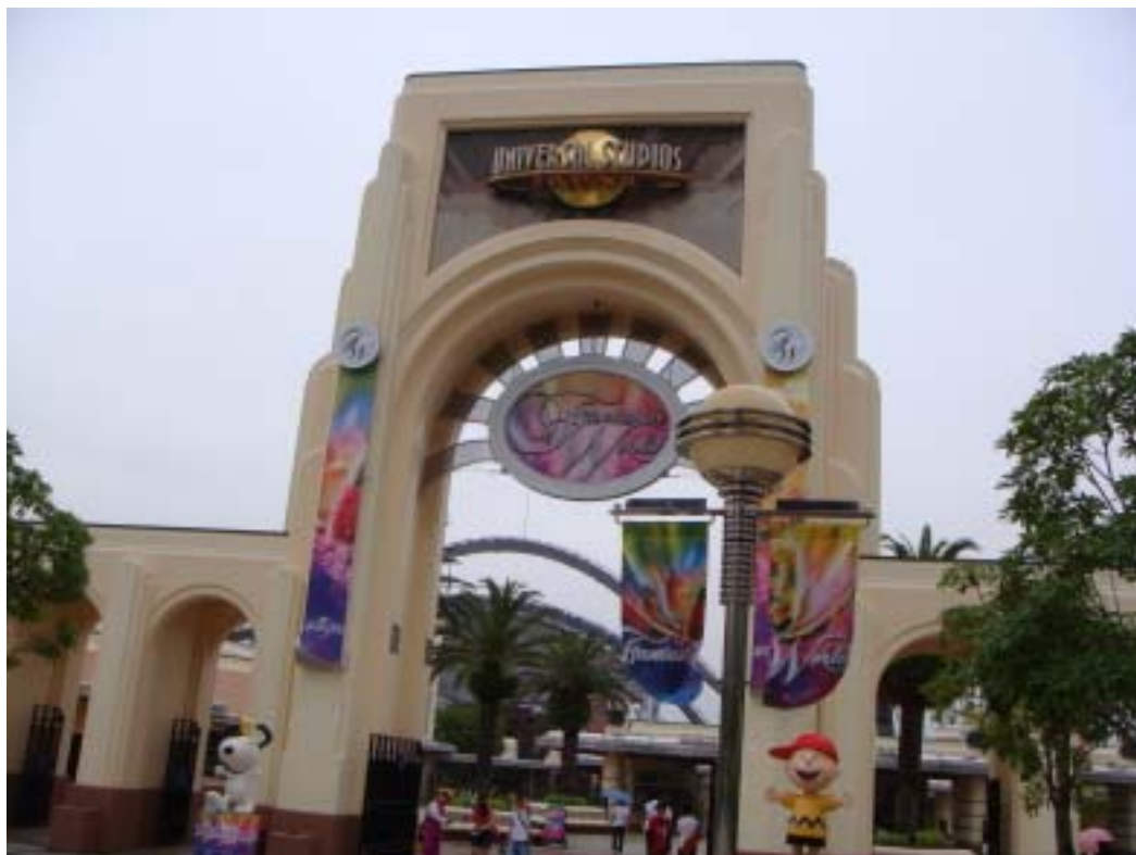
大阪環球影城入口

京都、大阪行的最後一站，就是前往大阪的環球影城，環球影城內有許多的遊樂設施及3D、4D劇場，而且演員們都表演的很好，像是在電影「大白鯊」的主題部分，乘坐船的時候，導遊演員就很投入的演出對決大白鯊的戲碼，魔鬼終結者2-3D則是融入3D電影及真人表演的方式演出；我在環球影城所乘坐的第一個遊樂設施是「Hollywood Dream」，當時是跟著人潮去做的，是屬於雲霄飛車類型的設施，而且椅背有喇叭，乘坐時會播放音樂，但是這個遊樂設施卻是環球影城內最刺激的遊樂設施，我當時就被其刺激的程度嚇到了，因為乘坐上去時還沒有心理準備。