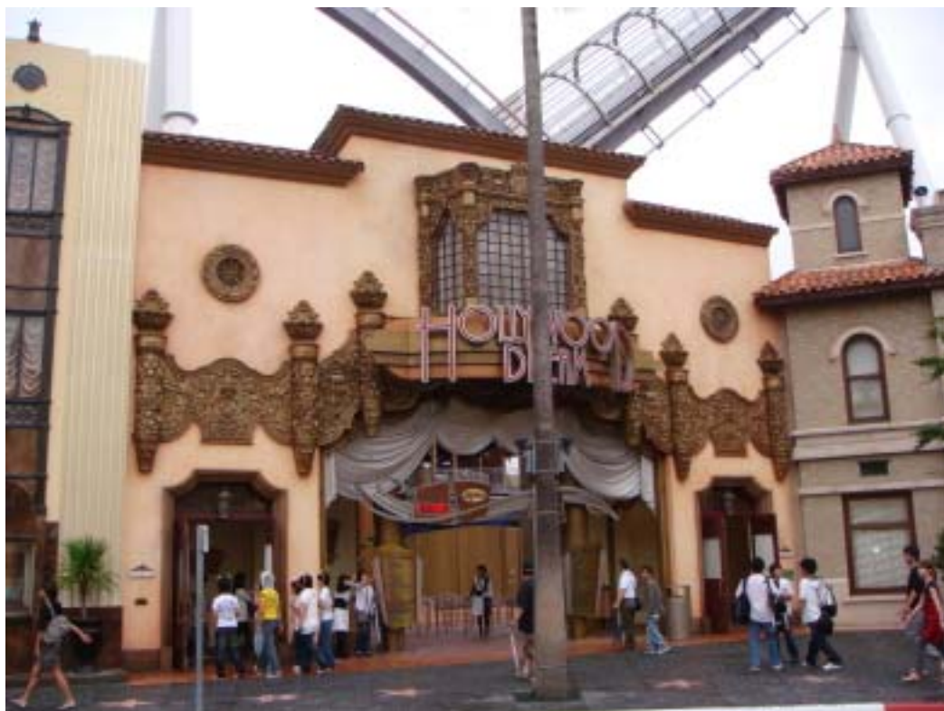
雲霄飛車 Hollywood Dream 入口處