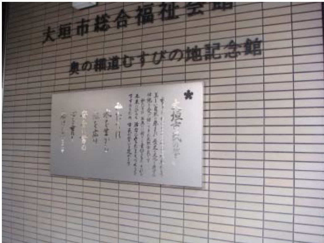
奥之細道終点處記念館