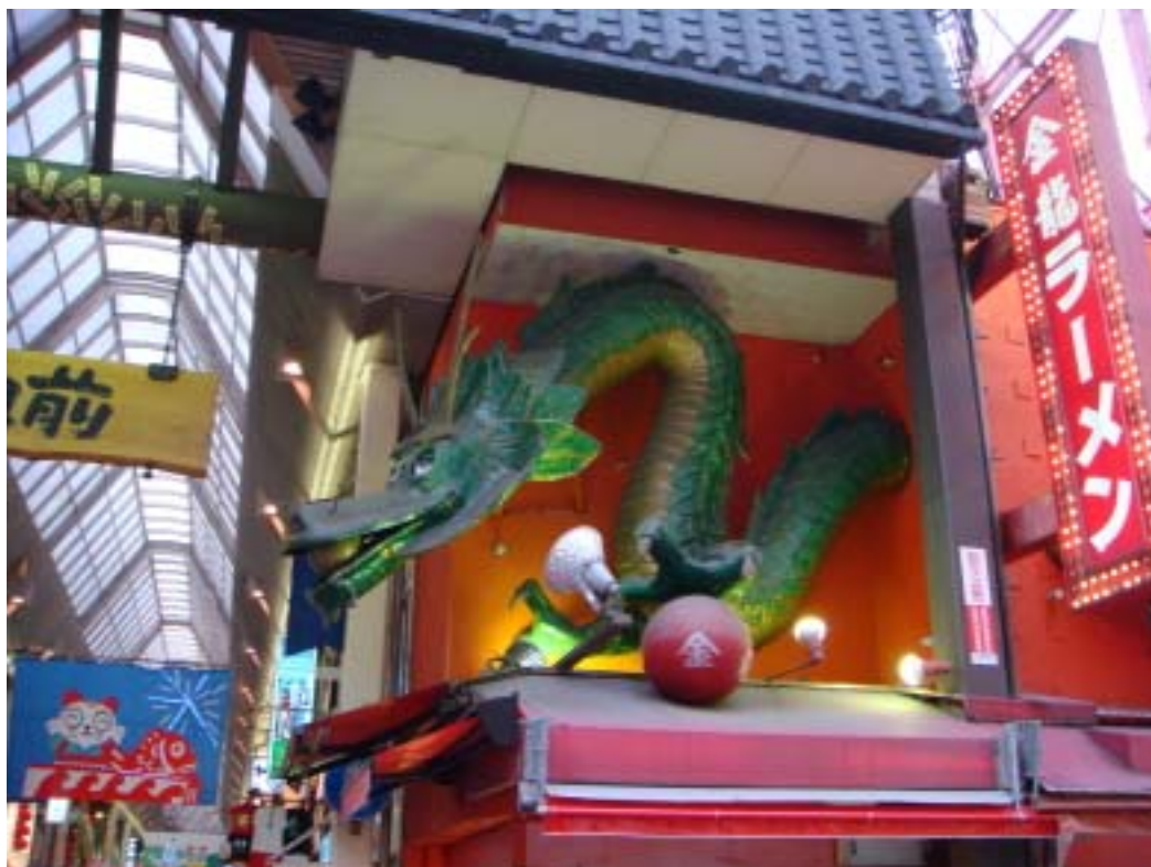
位於心齋橋、道頓堀一帶的金龍拉麵