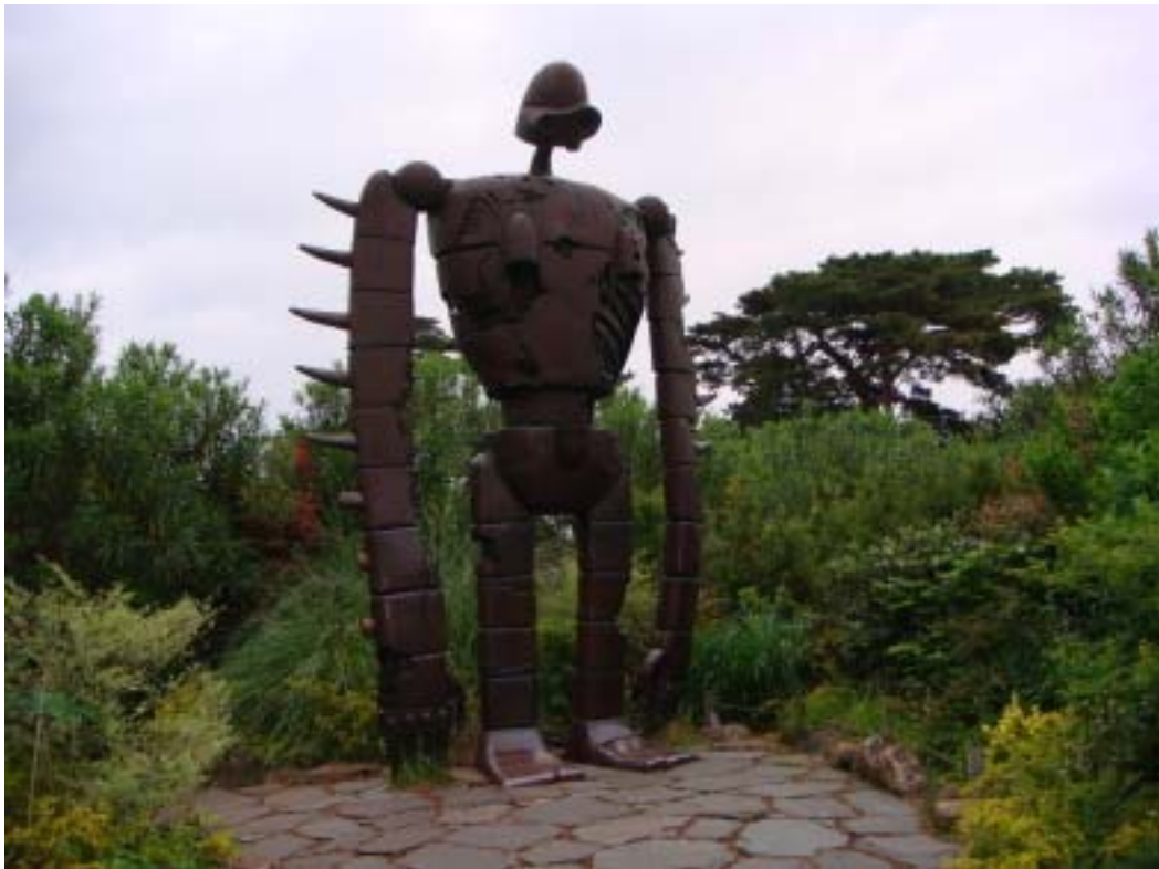
動畫「天空之城」的機器人，位於吉卜力美術館屋頂