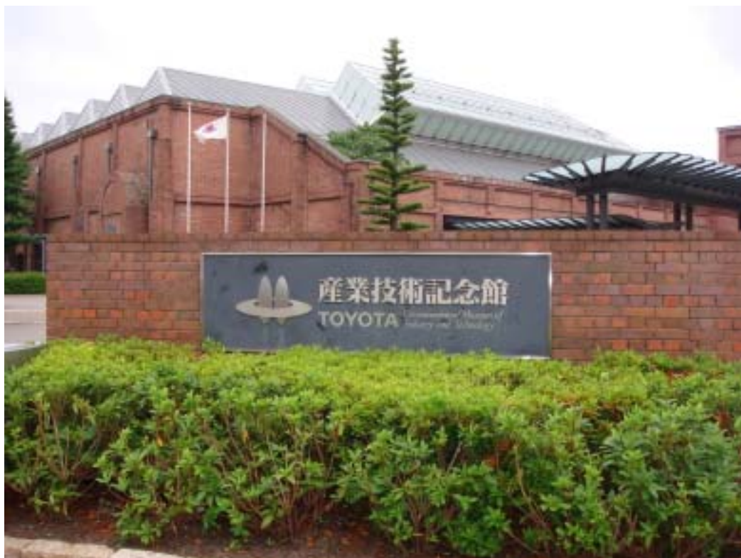
豐田產業技術記念館