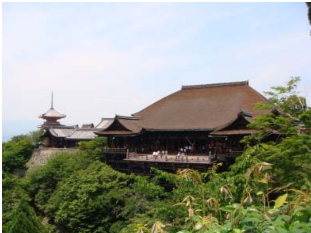
清水寺其中一座建築

在日本的最後一個月，進行了最後一次的旅行，而這次主要是去京都跟大阪，在京都，主要都是寺廟為主，我去了西本願寺、清水寺、金閣寺，還有到二條城去；西本願寺跟清水寺同被登記為世界遺產，只可惜西本願寺有部分在整修，沒能看到，而清水寺則是位於半山腰很大的寺廟，寺前有一小段商店街，有許多賣京都名產「八ッ橋」的店在那邊，我也試吃了一個，味道真的很不錯。清水寺的內部挺大的，要參觀須要花點時間，由於在山腰上，所以寺廟的建築也挺壯觀的。金閣寺是在聽聞其外觀都是金箔，所以會想要去親眼看看其金碧輝煌的樣子，金閣寺的入場券設計成符的樣子也是一個特色，走進去不一會的工夫就可以看到金閣寺，當時的感覺真的是嘆為觀止，整個建築物都是金色的，不管從哪個角度看，都很壯觀。二條城雖然沒有像名古屋城跟大阪城一樣有大型的城堡，但是已被列為國寶及世界遺產，進城參觀也可看到日本城堡之美。