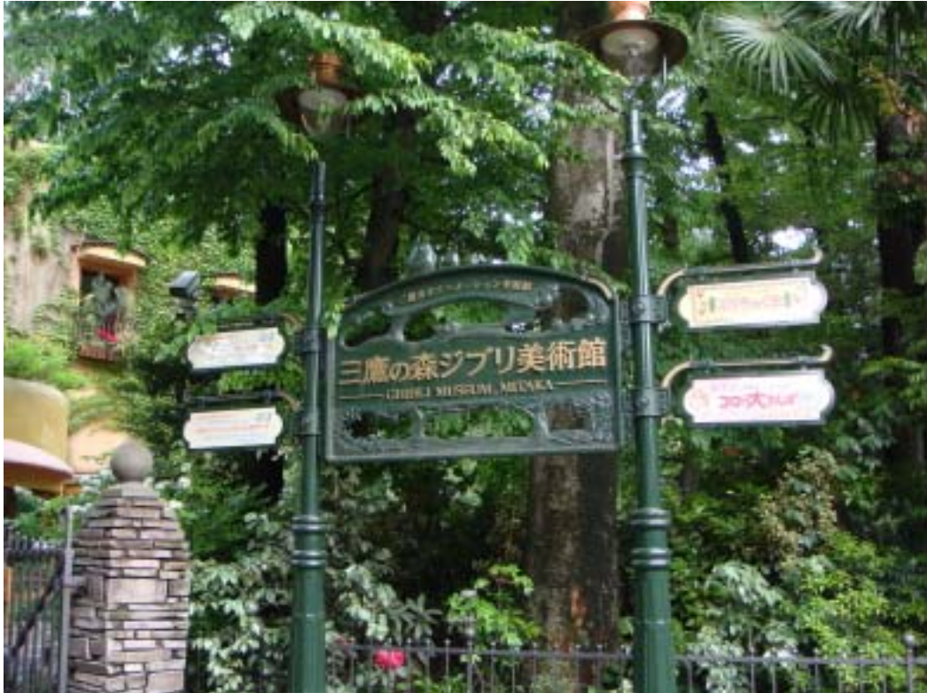
三應之森吉卜力美術館