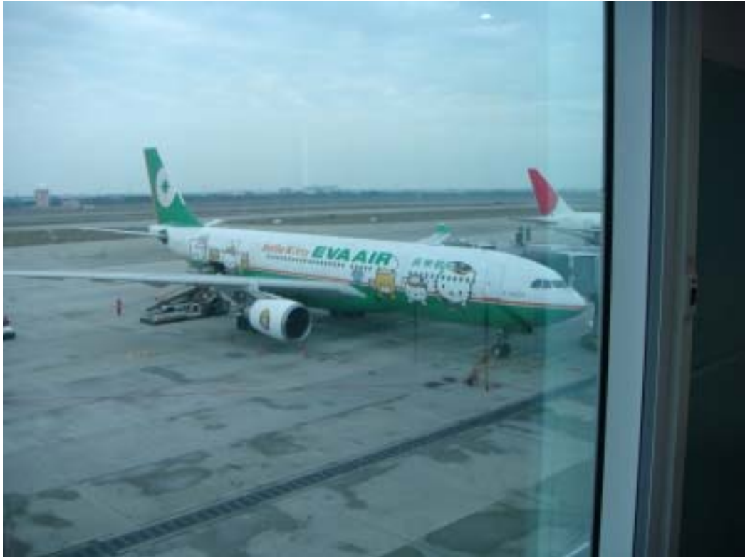
Hello Kitty Jet

另外，我搭乘的長榮班機是 Hello Kitty Jet，也就是飛機上有 Hello Kitty 的彩繪，機艙內的部分飾品也是有 Hello Kitty 的圖案，甚至於機上餐點的紙巾及包裝部分，都可以見到 Hello Kitty，真的是名符其實的「Hello Kitty Jet」，但是當初並不曉得是 Hello Kitty Jet，當時選班機時有華航及長榮兩家可選，不過基於自己對華航有點擔心，所以選擇了長榮。