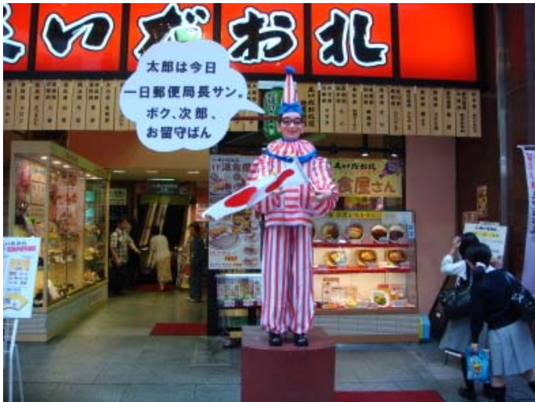
太郎去當一日郵局局長，次郎留守