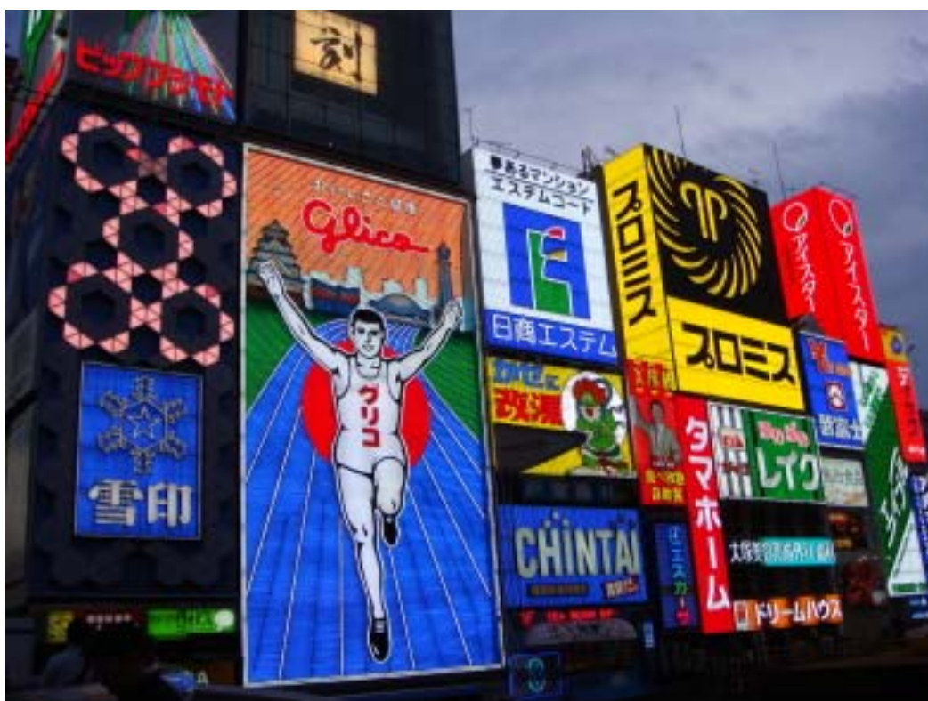
心齋橋商店街一帶的霓虹燈，glico 著名的跑步人像招牌在這