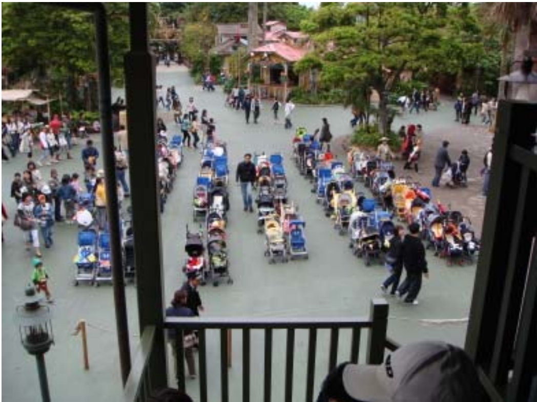
迪士尼樂園的特殊景觀，嬰兒車停車場