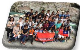
2017 年度日本員工旅遊