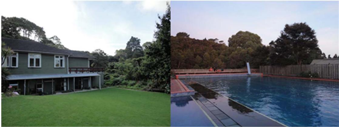
<圖十一、 住宿環境 >