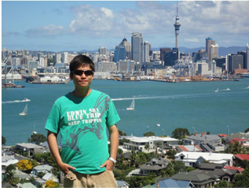
< 圖十、奧克蘭市區觀光 >