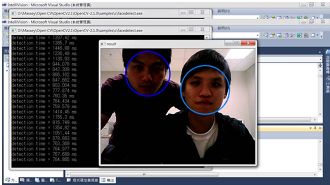
<圖八、實作的臉部偵測程式>

住宿方面，由於梅西大學沒有辦法提供短期住宿，我們自己找到位於學校附近的 Wellpark Retreat Centre。它是一個定期舉辦各種課程(包括自然療法、瑜珈、心靈成長)且鼓勵人親近大自然的機構。所有的房間皆鄰近樹林和草皮，機構內還包含露天游泳池和健行步道而且價格便宜，讓我們實習的這段期間住得非常健康、愉快。