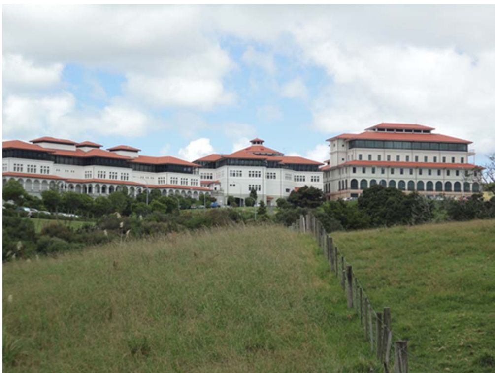
< 圖一、校園的一角 >

2011年1月19號我抱著既期待又不安的心情從桃園國際機場出發前往這次實習計畫的目的地-紐西蘭的奧克蘭市。在經歷包含轉機的十四小時的飛行後，終於抵達了這個被世人稱為最接近天堂的國度，並且直接驅車前往這次計畫的合作機構，梅西大學(Massey University)。