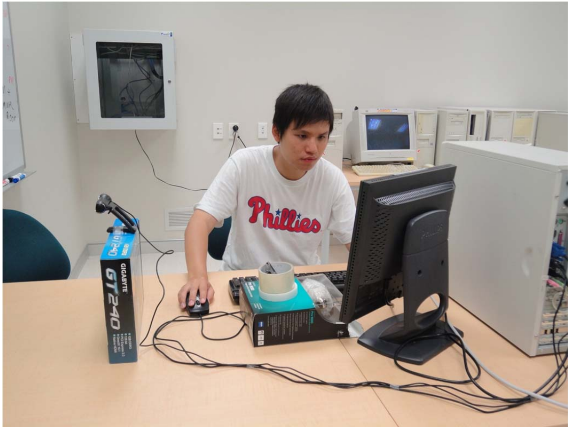
< 圖九、 平時在實驗室情形 >