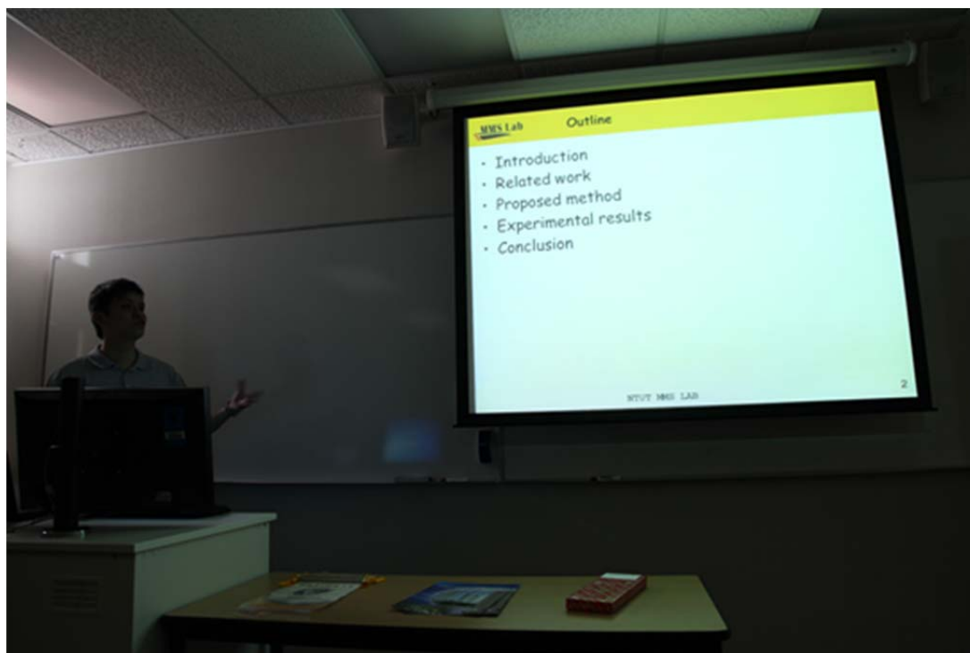
< 圖五、在研討會中作簡報 >